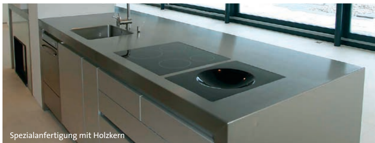
Spezialanfertigung mit Holzkern